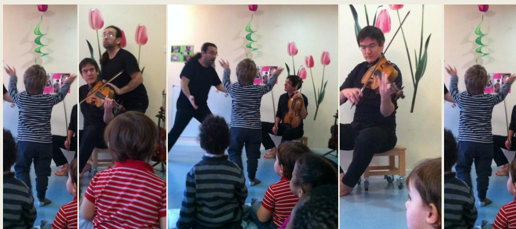
Crèche Maison-bleue de Chevilly-Larue, 12/2014

Qui n'a pas connu ce tout-petit, toujours en mouvement, qui découvre le monde en touchant à tout, en essayant tout, en riant, en criant, en courant... ce tout-petit qui n'en fait qu'à sa tête et qui, bien souvent, dépasse les adultes en énergie ?