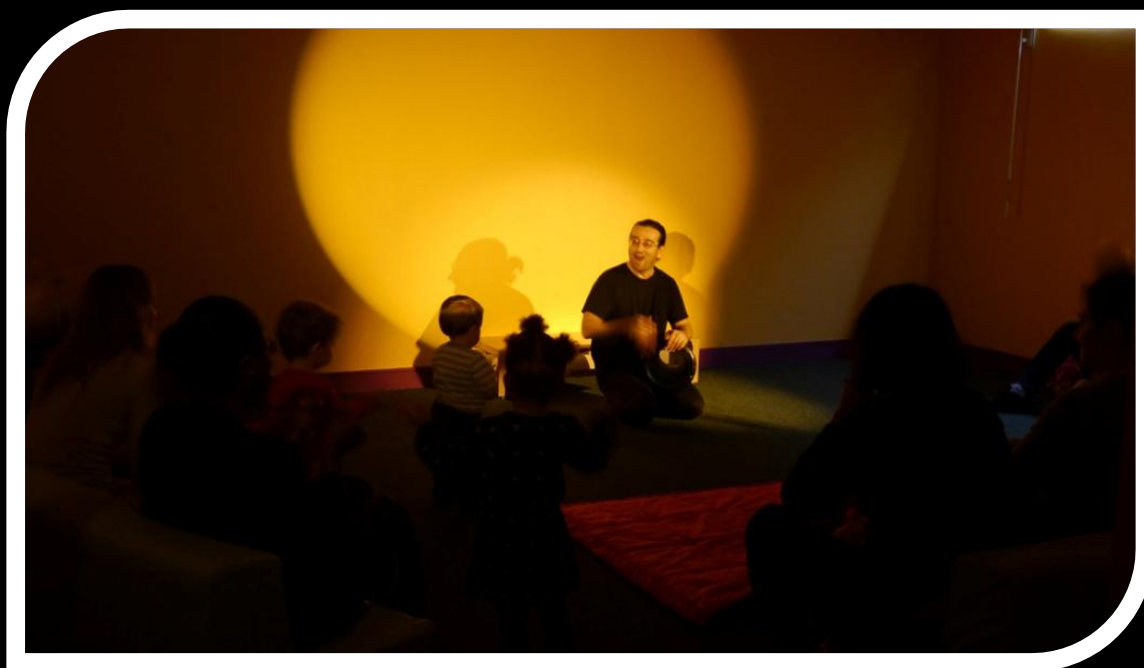
Monsieur Pouce met son chapeau - Médiathèque de Beauchamp - janvier 2014.

...Raconter Mr Pouce, c'est toujours une aventure !